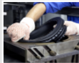
Formteile / Rubber moulded parts