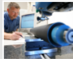
Walzen / Rollers